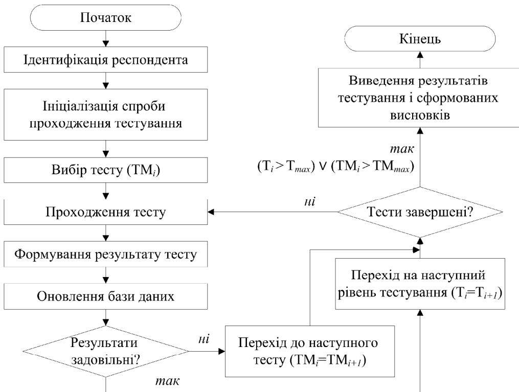
Рис. 3. Узагальнений алгоритм проведення багаторівневого адаптивного тестування

Процедура тестування за кожним тестом має такий вигляд: після підтвердження вибору певного тесту на моніторі відображаються правила проходження тесту, а після підтвердження ознайомлення з ними з'являються запитання або завдання тесту; відповіді респондента і час, затрачений на роздуми, фіксуються. В підсумку в кінці кожного тесту формується результат та оновлюється запис в базі даних. Якщо результати задовільні, то відбувається перехід на наступний рівень. Після завершення дослідження на екран виводиться результат.