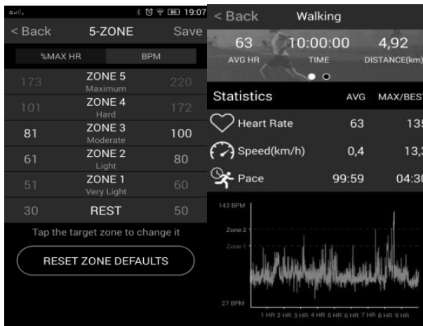
Рис. 2. Дослідження ЧСС з фітнес-браслетом MioFuse

При роботі з медичними гаджетами з вбудованими датчиками пульсу (практично було використано фітнес-браслет MioFuse) на екрані смартфона можна отримати інформацію про максимальне та середнє значення ЧСС, дистанцію, задати діапазон для кардіозон та отримати графічне зображення зміни ЧСС у часі (рис. 2).