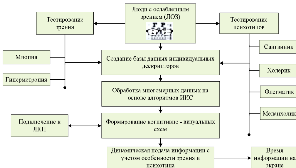
Рис. 1. Когнитивная SMART-технология ДО для ЛЮЗ

систем (ИИС). Далее формируются персонализированные когнитивно-визуальные цветосхемы (рис. 2). После подключения к ЛКП для работы с современным оборудованием промышленной автоматизации осуществляется динамическая подача обучающей информации.